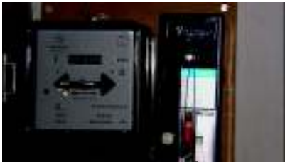
Contador e limitador