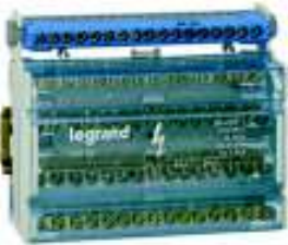
Barramento principal da alimentação