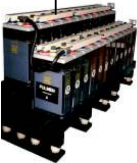
Banco de baterias